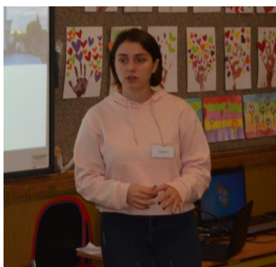
Mariam z Gruzie