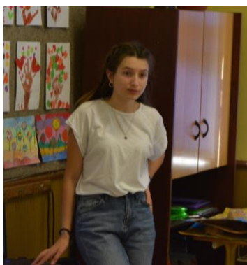
Viktoria z Ukrajiny