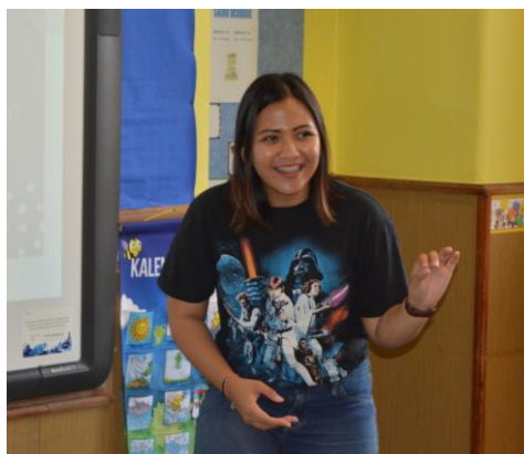
Syafira z Indonézie