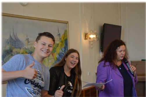
Školní fotograf a Žákyně měsíce