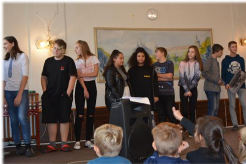
Tlumočníci Projektu Edison