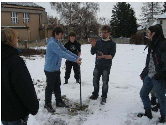
Projekty s EKODOMOVEM