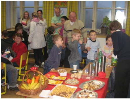
Vánoce s rodiči