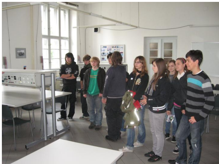
Exkurze 9.ročníku do SPŠ elektrotechnické v Kutné Hoře

Všichni žáci mají možnost v rámci hodin výchovy k občanství co nejlépe poznat samy sebe a své předpoklady ke studiu různých oborů. Jsou jim předávány informace o mnoha středních školách a odborných učilištích: Jsou informováni o dnech otevřených dveří na školách. Tyto a další informace mohou nalézt přímo u výchovného poradce v konzultačních hodinách, mohou sledovat jeho webové stránky, či hledat informace na nástěnce výchovného poradce.